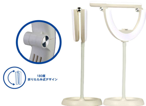
折りたたみ式デザイン