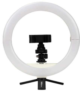
スマホホルダー/ミニ三脚 装着時