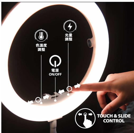
タッチ & スライド調整機能