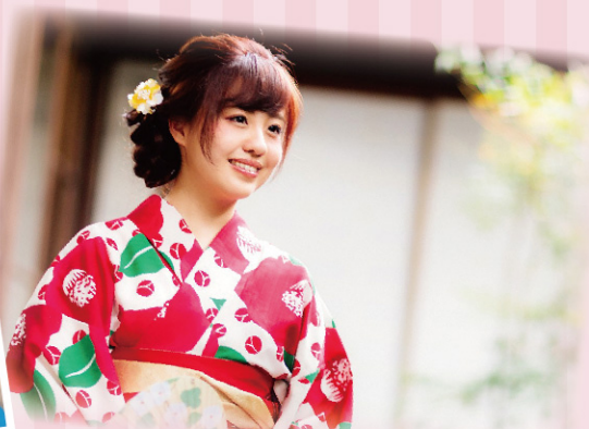
※写真はイメージです。実際のモデルとは異なります。